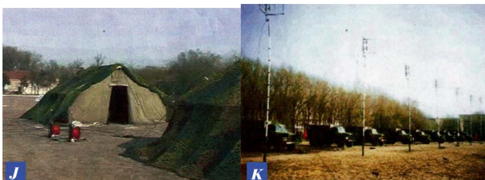
J: 用便携式多功能救灾工具搭架帐篷