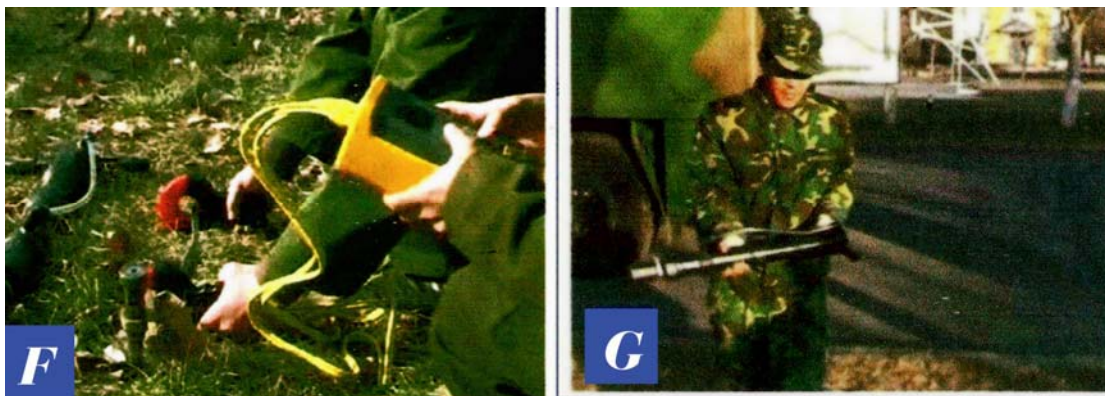
F: 用数字式接地电阻测试仪测试便携式多功能救灾工具在打拔钎钉的地阻, 测试结果发现工具在打拔的过程中地阻很小。