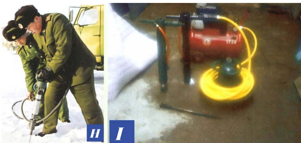
H: 军人在冰天雪地的环境下使用便携式多功能救灾工具。